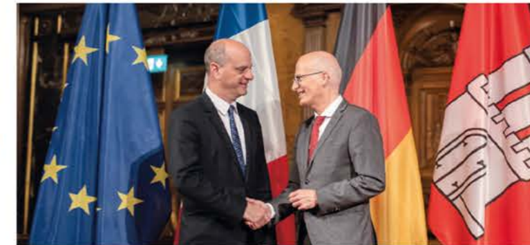
Im Juni 2018 traten zum siebten Mal Kultusministerinnen und Kultusminister der deutschen Länder und französische Recteurs und Rectrices d'Académie zusammen. Der Bevollmächtigte Dr. Peter Tschentscher, der KMK-Präsident Hmut Holter und der französische Erziehungsminister Jean-Michel Blanquer hatten dazu nach Hamburg eingeladen. En juin 2018, les ministres de l'Éducation des Länder allemands ainsi que les rectrices et recteurs d'académie français se sont rencontrés pour la septième fois. Ils avaient été invités à participer à cette réunion de travail à Hamburg par le Plénipotentiaire, Peter Tschentscher, le président de la KMK Helmut Holter et le ministre de l'Éducation nationale français, Jean-Michel Blanquer.