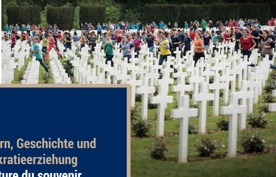
Gedenkveranstaltung mit 4.000 Jugendlichen in Verdun, 2016 Commemoration de la bataille de Verdun avec 4 000 jeunes, 2016