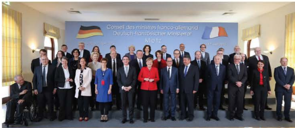
Jugendaustausch anlässlich des Deutsch-Französischen Ministerrates 2017, Paris Échange de jeunes lors du Conseil des ministres franco- allemand 2017, Paris Deutsch-Französischer Ministerrat 2016, Metz Conseil des ministres franco-allemand 2016, Metz