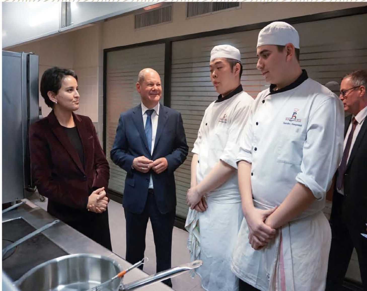
Der Bevollmächtigte und Erziehungsministerin Vallaud-Belkacem beim Besuch einer Berufsschule, Deutsch-Französischer Tag 2016, Paris Le Plénipotentiaire et la Ministre Vallaud-Belkacem lors de la visite d'un lycée des métiers, journée franco-allemande 2016, Paris Senatskanzlei Hamburg

Freischaltung der Plattform Écoles-Entreprises 2016 Lancement de la plateforme Écoles-Entreprises 2016 AHK®