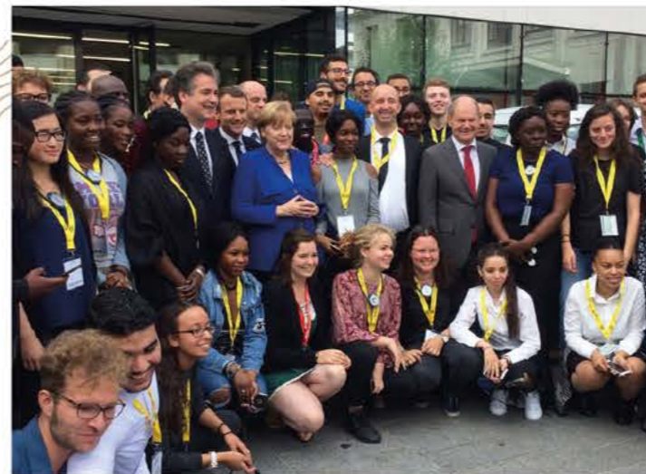
Der Bevollmächtigte mit dem französischen Erziehungsminister Jean-Michel Blanquer, 7. Recteurs-Kultusministerkonferenz 2018, Hamburg Le Plénipotentiaire avec le Ministre de l'Éducation nationale, Jean-Michel Blanquer, 7e conférence des Recteurs et Ministres de l'Éducation des Länder allemands 2018, Hamburg