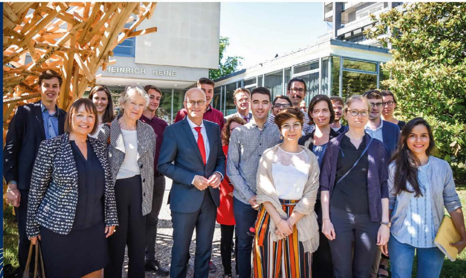
Besuch des Bevollmächtigten im Heinrich-Heine-Haus 2018, Paris Visite du Plénipotentiaire à la Maison Heinrich Heine 2018, Paris Senatskanzlei Hamburg®