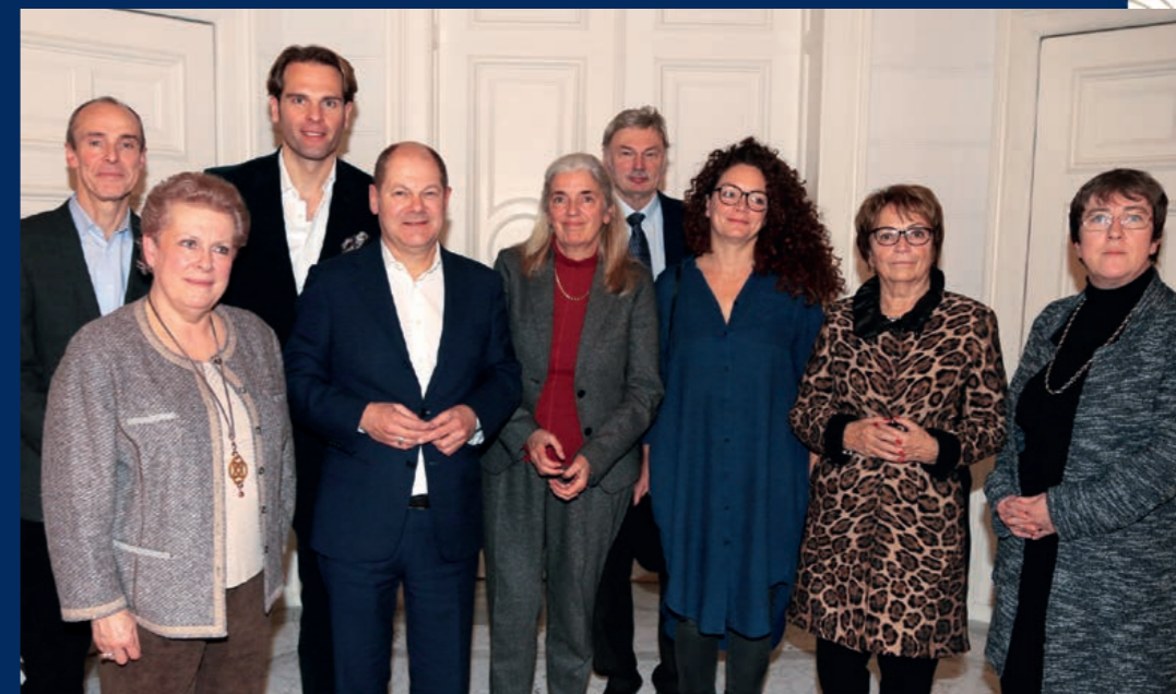
Der Bevollmächtigte beim Deutsch-Französischen Kulturrat 2016, Hamburg Le Plénipotentiaire lors du Haut Conseil Culturel franco-allemand 2016, Hamburg