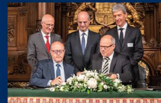
Unter dem Motto „Deutschland und Frankreich – ein lebendiges Laboratorium für Europa“ wurden Schwerpunktthemen wie die Kooperation im Bereich hochwertiger Beruflicher Bildung, Sys- tematisierung von Mobilität, strategische Partnerschaften und Förderung der Partnersprache diskutiert. La rencontre placée sous le titre « L'Allemagne et la France – un laboratoire à vocation européenne » les thèmes clés comme la coopération dans de domaine de l'enseignement et la formation professionnels, la systématisation de la mobilité, la mise en place de partenariats stratégiques et la promotion de la langue du par- tenaire ont été discutés.