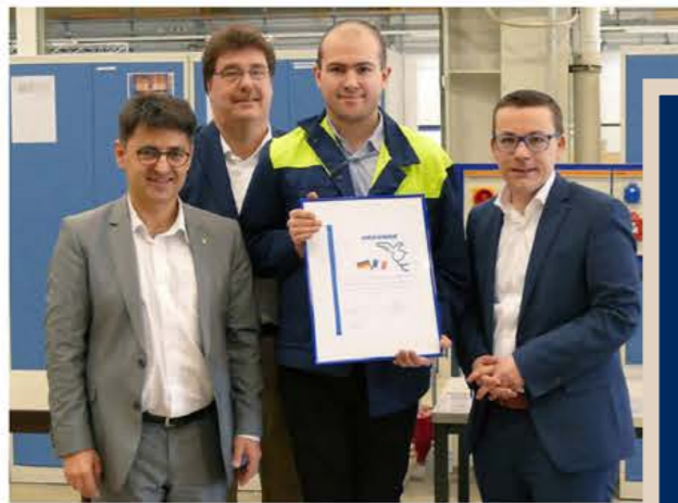
Der erste Absolvent einer grenzüberschreitenden Ausbildung bei Michelin 2018 Le premier diplômé ayant effectué un apprentissage transfrontalier chez Michelin 2018 Michelin®