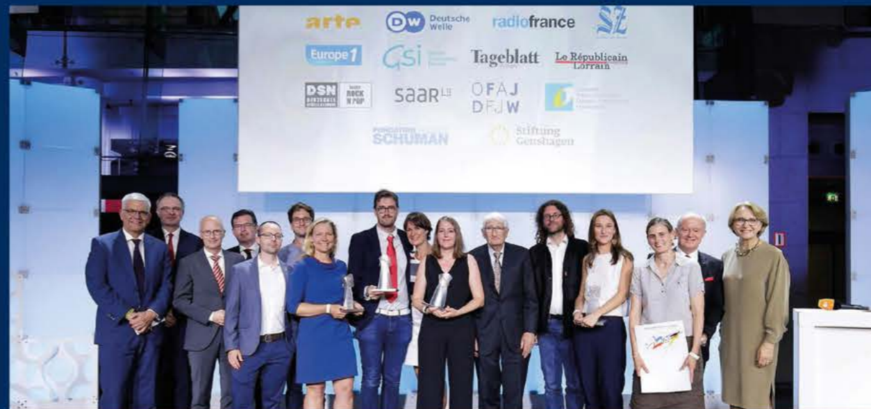
Der Bevollmächtigte beim Deutsch-Französischen Journalistenpreis 2018, Berlin Le Plénipotentiaire lors de la remise du prix franco-allemand du journalisme 2018, Berlin