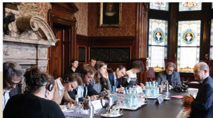
Der Bevollmächtigte im Gespräch mit französischen Journalisten 2016, Hamburg Le Plénipotentiaire en discussion avec des journalistes français 2016, Hamburg Senatskanzlei Hamburg®

la France comme invitée d'honneur à la Foire du livre de Francfort (2017) et le programme culturel franco-allemand Frankfort en français , qui a accompagné la manifestation dans l'Allemagne entière, le prix annuel franco-allemand du journalisme pour journalistes et professionnels engagés, les plénières annuelles du Haut Conseil culturel franco-allemand et le Reeperbahnfestival de Hamburg avec la France comme pays partenaire (2018).