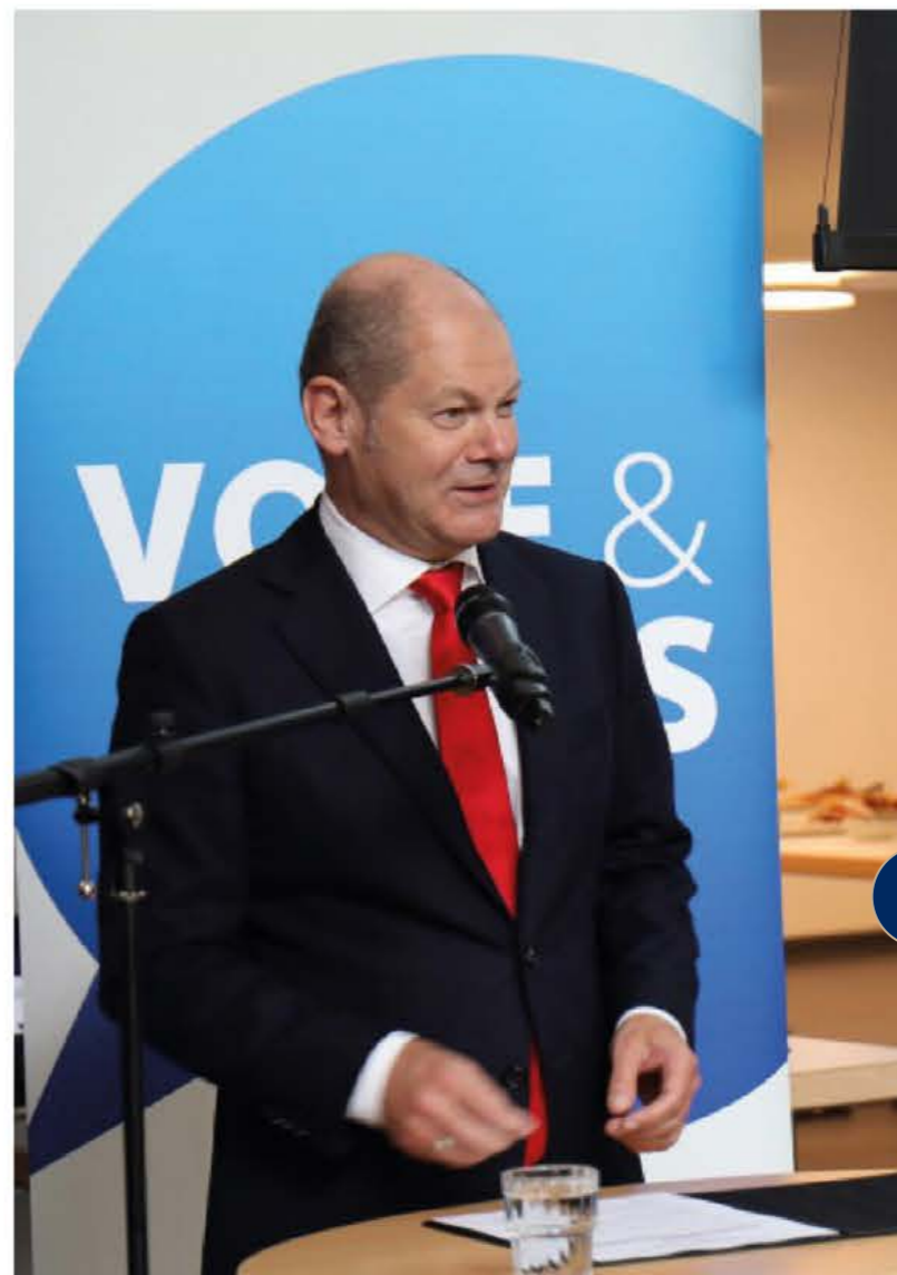
Konferenz von Vote & Vous in Kooperation mit dem DFJW 2017, Hamburg Conférence Vote & Vous en coopération avec l'OFAJ 2017, Hamburg Senatskanzlei Hamburg®

Une culture active du souvenir portée par un dialogue permet de perpétuer la mémoire européenne commune de ce patrimoine historique au service d'une Europe forte aujourd'hui comme demain.