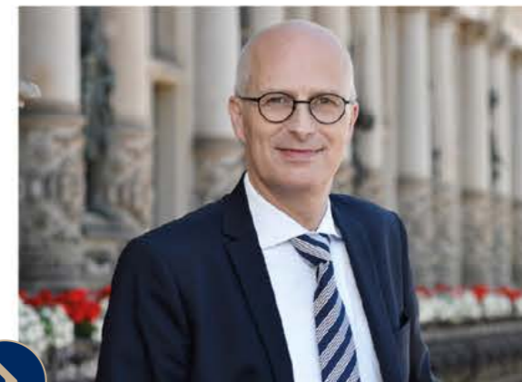
Erster Bürgermeister der Freien und Hansestadt Hamburg Dr. Peter Tschentscher

Ich danke all diesen Partnern sowie dem Büro I und dem Büro II für ihr Engagement und für ihre Unterstützung.